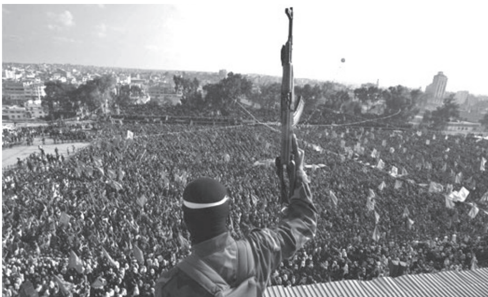
Palestinos respaldam a firmeza do Hamas no combate ao agressor sionista

Ele disse que depois desta vitória, há ainda duas outras batalhas, uma para romper o cerco e a segunda para abrir as passagens de fronteira, salientando que o Hamas e o governo do primeiro ministro palestino Ismail Haneyya reassumiu