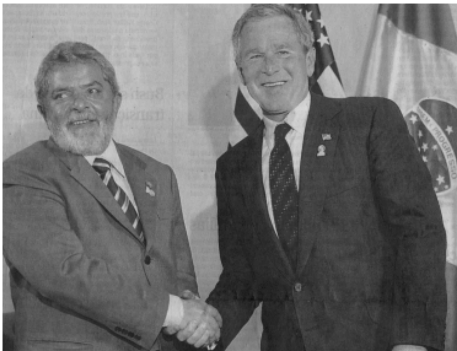
Lula gerente de turno promove a maior derrama da história do Brasil

É, pois, tarefa do proletariado, em aliança com os camponeses pobres, estudantes, intelectuais honestos, mulheres, democratas e revolucionários,